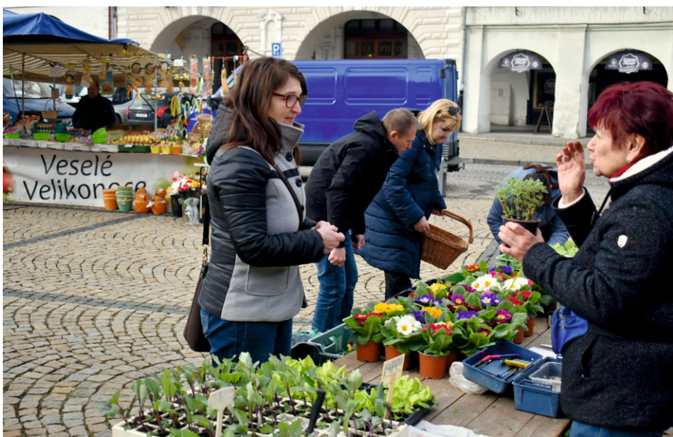
Jarní atmosféru ve městě vytváří v těchto dnech velikonoční výzdoba na náměstí Svobody nebo opakované jarní farmářské trhy.

Můžete nominovat na ocenění Aktivní žák ... str. 13