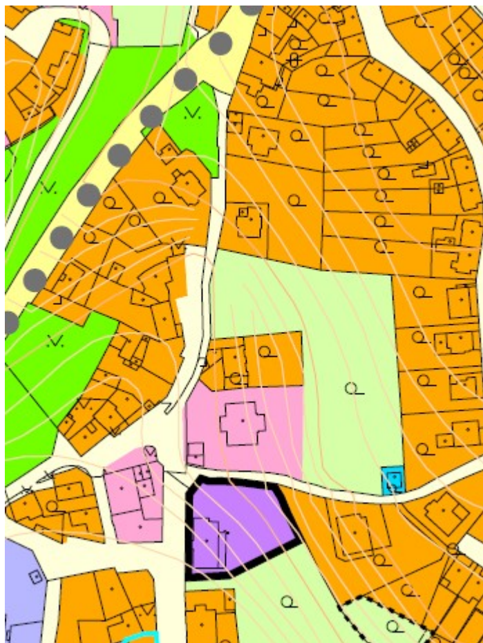
Výřez z platného územního plánu

Úřad územního plánování, jako pořizovatel, posoudil předložený návrh na změnu územního plánu z hlediska úplnosti návrhu a jeho souladu s právními předpisy a konstatuje, že návrh obsahuje veškeré požadované náležitosti dle odst. 1 § 46 stavebního zákona a je v souladu s právními předpisy . Z výše uvedeného důvodu pořizovatel souhlasí s pořízením změny Územního plánu Žatec – úplné znění po změně č. 1-9 a č. 11-13, změna využití pozemku p.p.č. 4470/9 k.ú. Žatec z plochy Zemědělské plochy – zahrady a sady na plochu Bydlení individuální a doporučuje variantu b) .