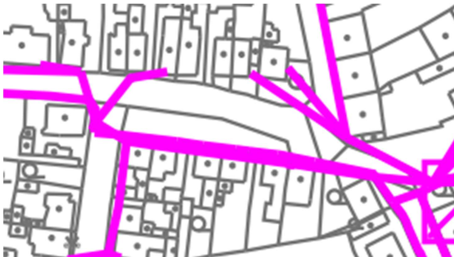
Vyznačení komunikačního vedení