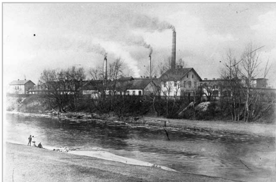
Mendlova továrna - pohled od jihu pře řeku Ohři