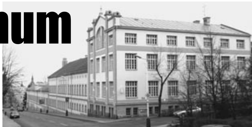
Areál papíren začne postupně měnit svoji tvář.

Jenže podle současné legislativy představuje vyhlášení ochranného pásma zásadní problém. Jestliže by kvůli respektování jím stanovených zásad vznikly majitelé, firmě Agile, nějaké vícenásledky a nebo by nemohla vůbec začít stavět, muselo by město (nikoli stát!) tuto částku uhradit ze svého rozpočtu. Zástupce firmy na jednání s představiteli města uvedl, že by šlo o zhruba 20 milionů korun. Co by se tím ale změnilo pro areál papíren? Chát-