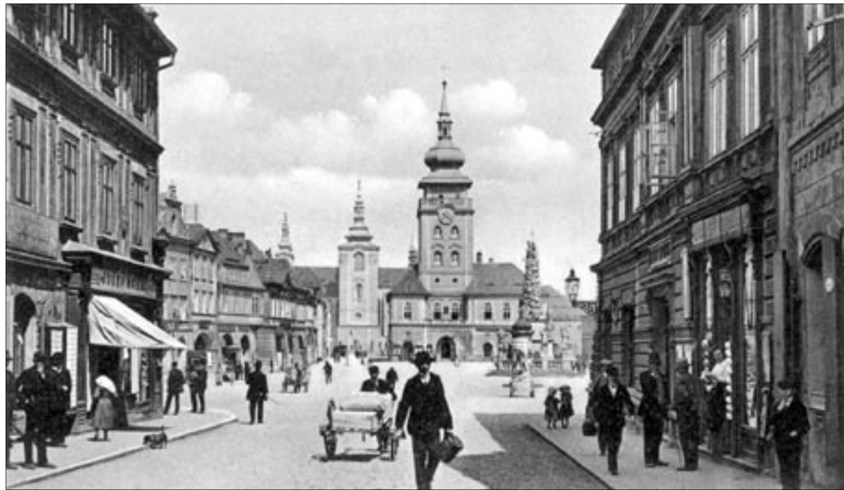
Pohled na náměstí Svobody směrem z ulice Obránců míru (rok 1911)

Přinášíme první pohlednic z plánovaného seriálu, který bude přibližovat podobu města mezi lety 1900-1945. Pohlednice své sbírky zapůjčil žatecký patriot Jan Řánek. Knižní podobu pod názvem Žatecko na starých pohlednicích můžete zakoupit v Turistickém informačním centru za 399,- Kč.