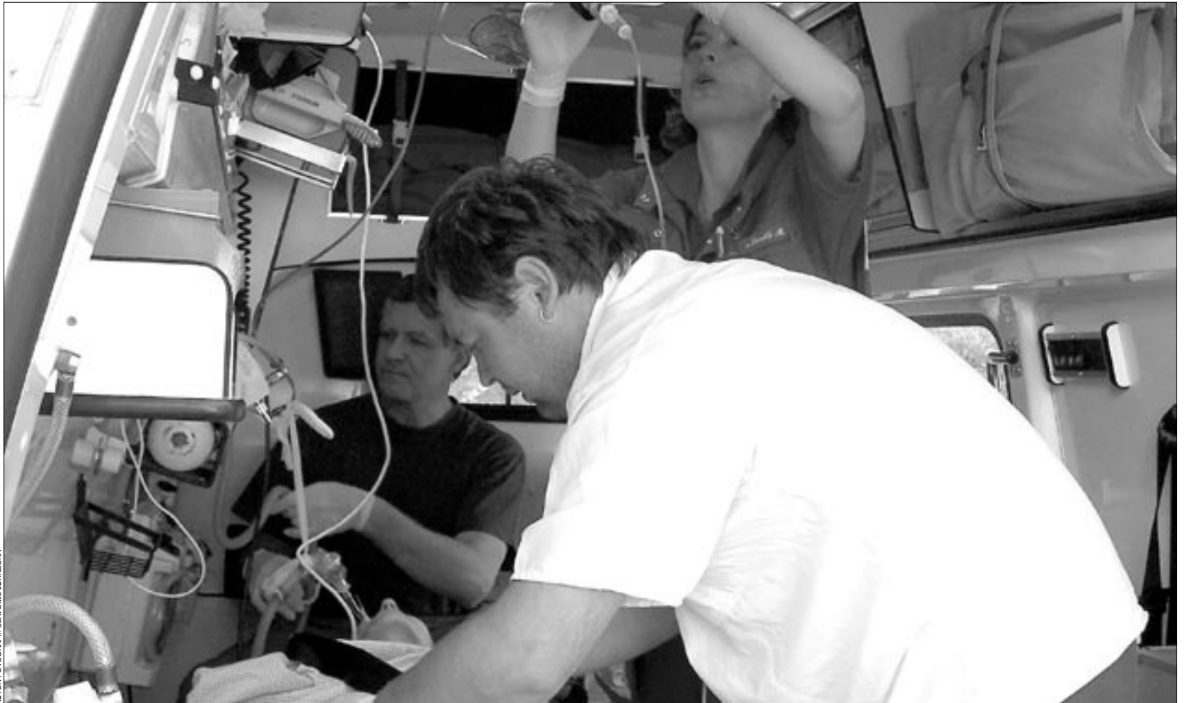
Ve vozidle rychlé lékařské pomoci. Žena je napojena na umělou plicní ventilaci, probíhá poslední zajišťování pacientky před odjezdem.

Vážení čtenáři, své dotazy, podněty a připomínky zasílejte na e-mailovou adresu tydenik@mesto-zatec.cz, nebo na adresu Městský úřad Žatec, náměstí Svobody čp. 1, Žatec 438 01 a materiál označte slovem TÝDENÍK.