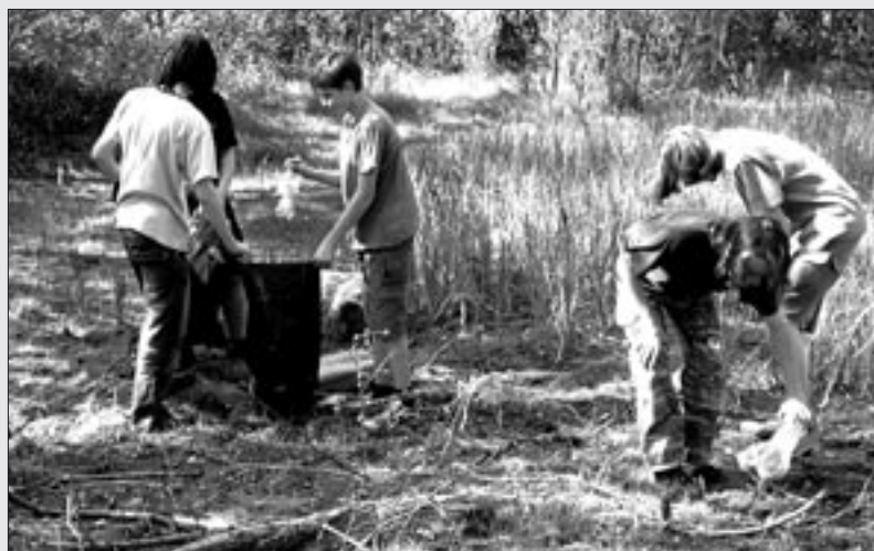
Turistické sdružení dětí a mládeže – Šamani Žateca Klub deskových her Sisyfos Žatec se podíleli v sobotu 28. 4. na úklidu koutku přírody BUFO. Oproti minulým letům byl nepořádek o něco menší, přesto tento přírodní koutek bezesporu „prokoukl“.