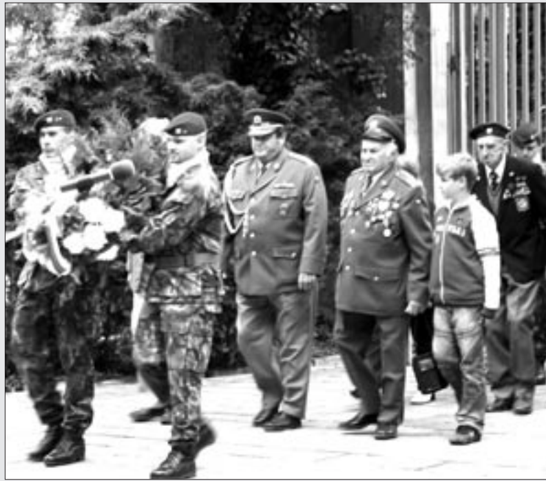
Váleční veteráni salutují při pietním aktu, při kterém uctili oběti 2. světové války. Na městském hřbitově a posléze i na Kruhovém náměstí se jim poklonili také zástupci radnice a politických stran.

Návody na malování zvířátek či figurek doprovázené básničkou a s předlohou v originální velikosti.