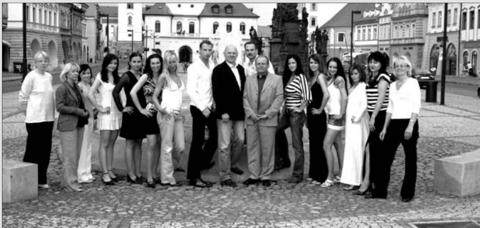
Dívky vybrané pro Miss pózuji na náměstí Svobody se členy štábu a porotci.

Antukové kurty měly malou schopnost sání vody po deštích, což je vyřazovalo z provozu. Jako jediný možný způsob odstranění tohoto stavu se ukázala být oprava, již provedla firma ze Staré Boleslavi. TJ se na této akci také významně finančně podílela. (st)