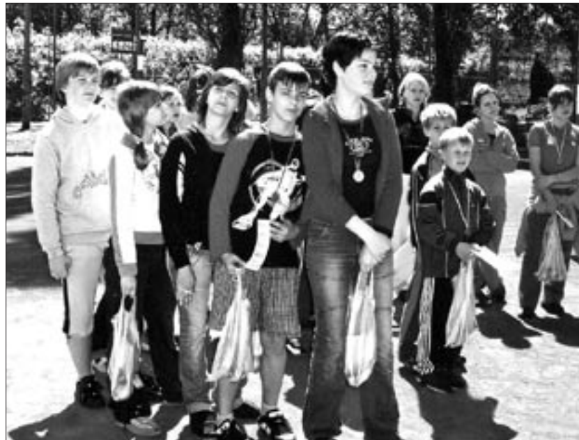
Vyznamenání mladí sportovci z TJ Sever, kteří se zúčastní krajského kola v Bílině.