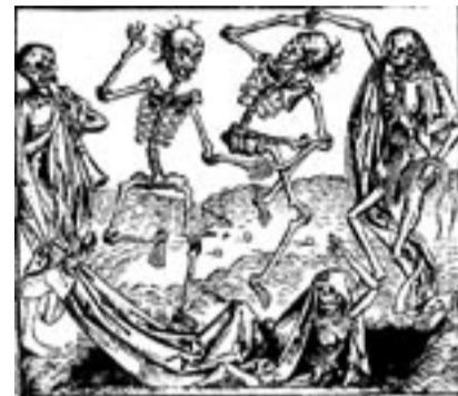
Středověká rytina s výjevem „Tance smrti“