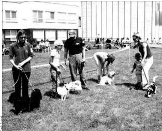
Voříšci do 35 cm při nástupu.