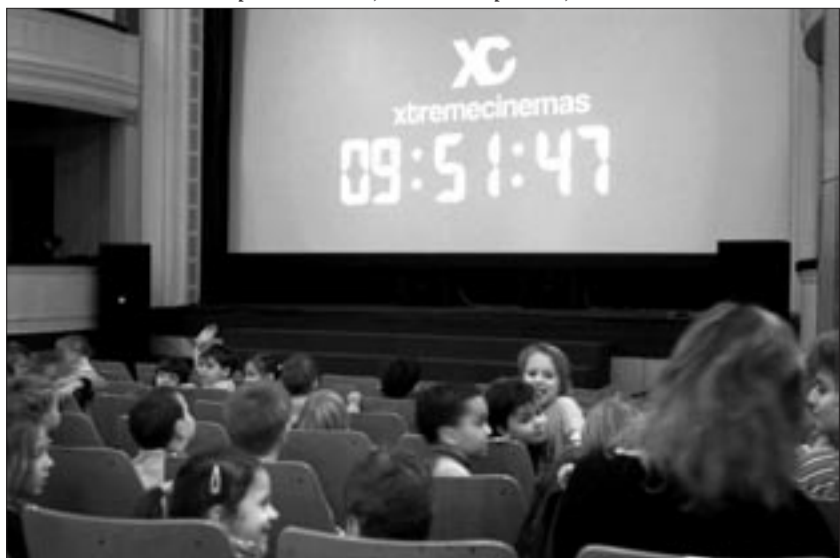
Kompletní program vždy na www.divadlozatec.cz