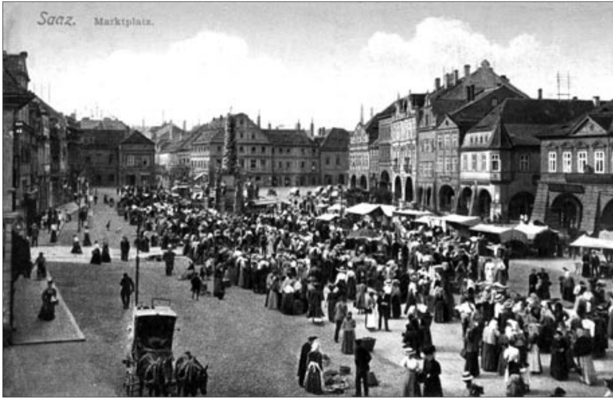
Trhy na náměstí Svobody (1914)