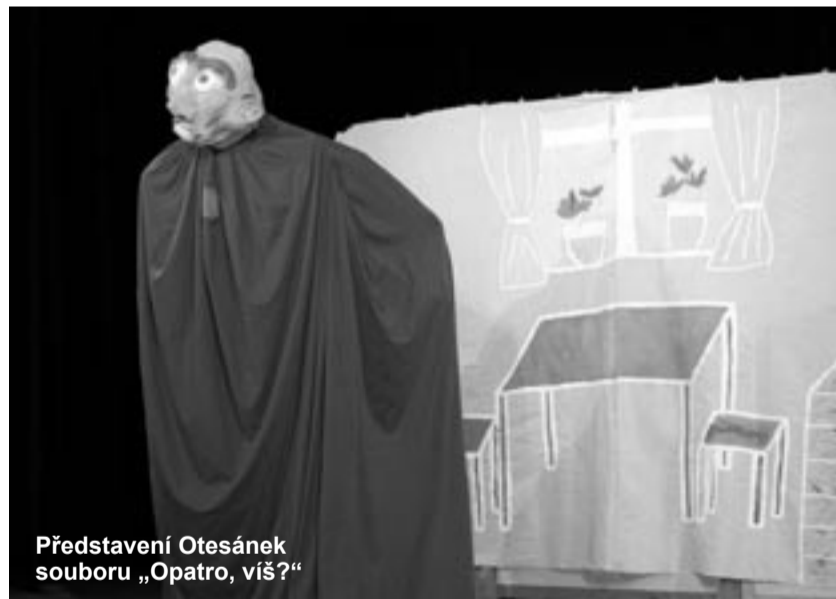
Představení Otesánek souboru „Opatro, víš?“