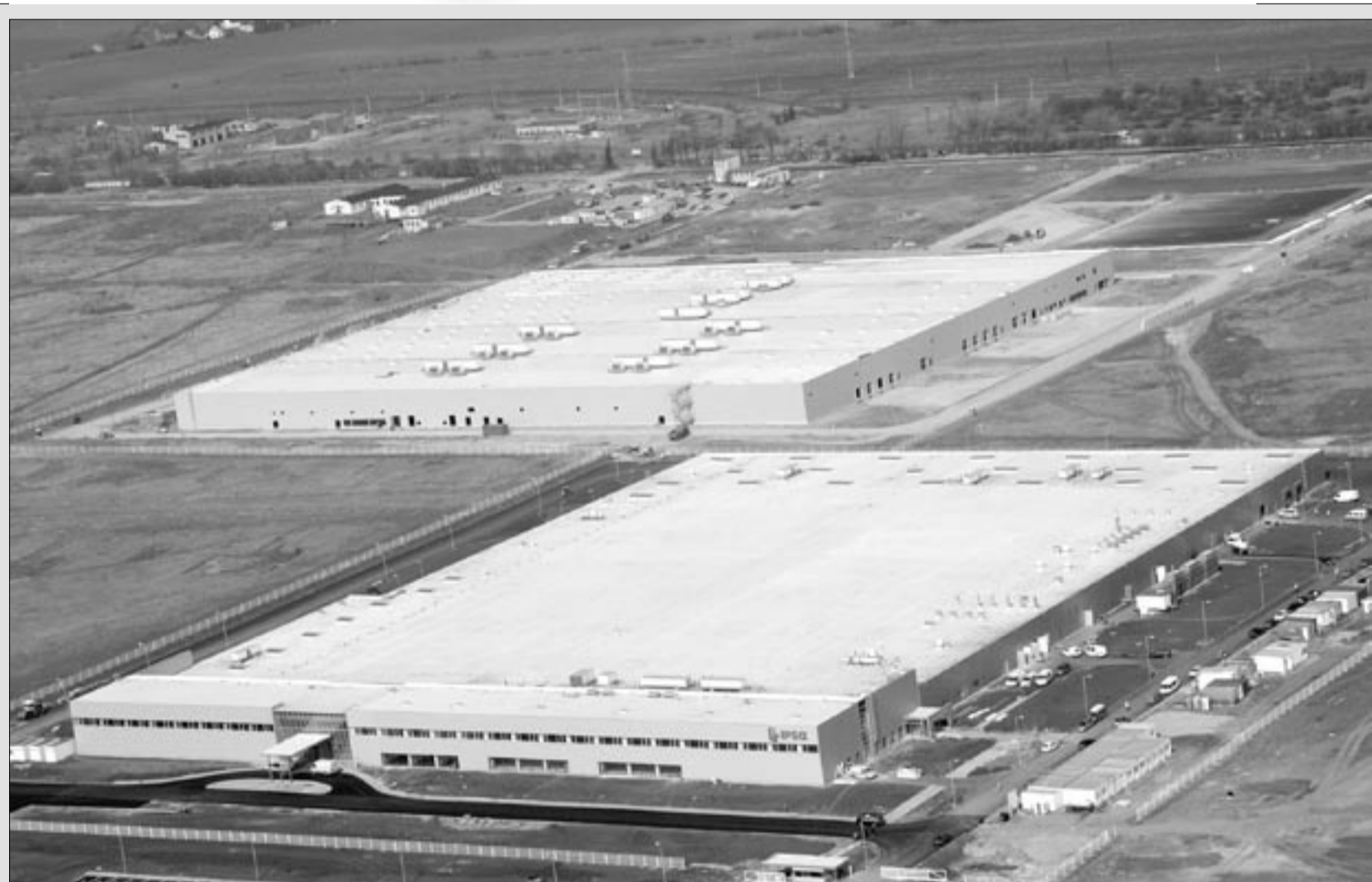
Letecký pohled na zastavěnou část průmyslové zóny Triangle. Obří tovární haly patří firmám IPS Alpha a Hitachi. V budoucnu by mělo v zóně najít práci na 15 tisíc obyvatel.