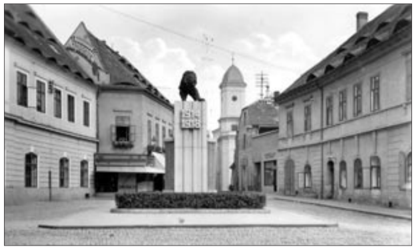
Pomník obětem I. světové války v místě dnešní chmelničky (1936)