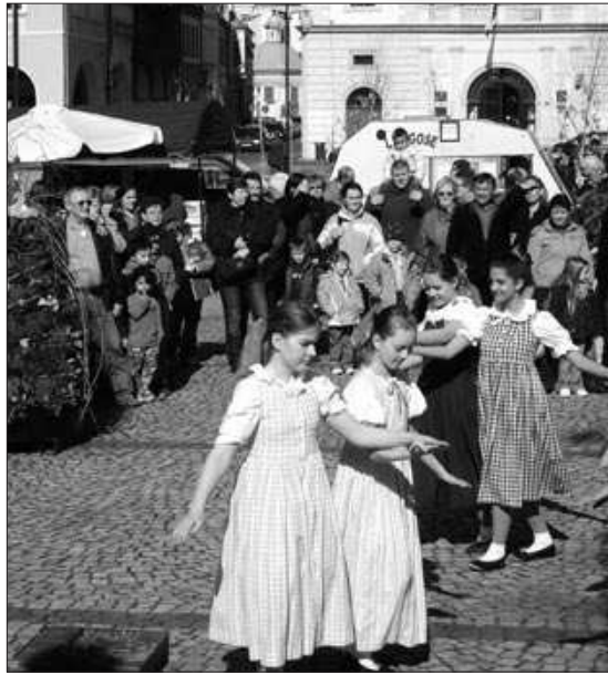
Divky ze základní umělecké školy při jednom ze sobotních vystoupení. Na sousedním snímku zdobí děti z mateřinky U Jezu jednu z velikonočních břízek na náměstí.

V souvislosti s tímto výjezdem byli uvedeni do pohotovosti žatečtí dobrovolní záchranáři, kteří jsou vybaveniavinovacími nosítky pro transport ve složitém terénu. Z důvodu relativně dobrého přístupu ke zraněnému, jeho stabilizovaného stavu a díky nabídnuté pomoci dalších motokrosových jezdců nemuseli být dobrovolníci nakonec povoláni. Slavomír Jurnečka, pracovník ZZS Žatec