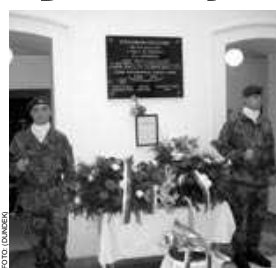
a k opětovnému nastolení demokracie. Jejich akce, byť neměla šanci na úspěch (o to více se však musíme těmto mužům obdivovat), byla vyzrazena a celá skupina, nesoucí jméno Praha-Žatec, skončila před soudem. Soud vynesl již zmíněných pět rozsudků smrti, dalších pět mužů bylo odsouzeno na doživotí.

Mezi nejvyšší mravní ideály patří láska ke svobodě, čestné jednání a účast s trpícími a bezmocnými. Největším zlem je naopak lhostejnost. Vydat se cestou lhostejnosti je to, co člověka činí nelidským. Lhostejnost je mnohem nebezpečnější, než-li hněv a nenávisť. Hněv může být občas tvůrčí. Může stvořit velkou báseň, velkou symfonii. Jindy se může mnoho vykonat pro věc humanity, pokud někdo svůj hněv obrátí proti nespravedlnosti, ježimž je svědkem. Lhostejnost však nikdy není tvůrčí. Dokonce i nenávisť může někdy vyvolat odezvu. Bojujete proti ní. Odsuzuje ji. Potíráte ji. Lhostejnost nevyvolává žádnou odezvu. Lhostejnost není odpověď. Lhostejnost není začátek; je to konec. Lhostejnost je proto vždy přítelkyní zla.