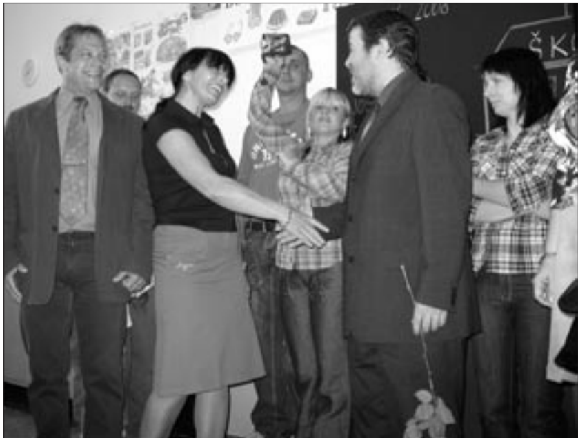
Starosta Erich Knoblauch přeje hodně štěstí do nového školního roku paní učitelce na ZŠ Komenského alej.

Z technických důvodů budou dne 05.09.2008 ukončeny úřední hodiny na pracovištích Městského úřadu v Žatci v budově radnice, nám. Svobody 1 v 11,00 hod. Děkujeme za pochopení.