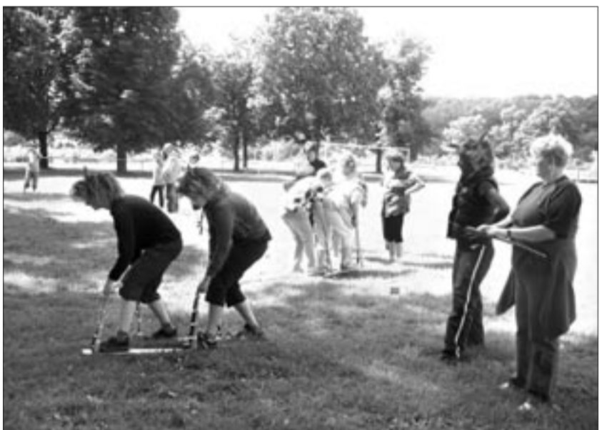
Na snímku ženy zdolávají určenou trasu na „lyžích“.