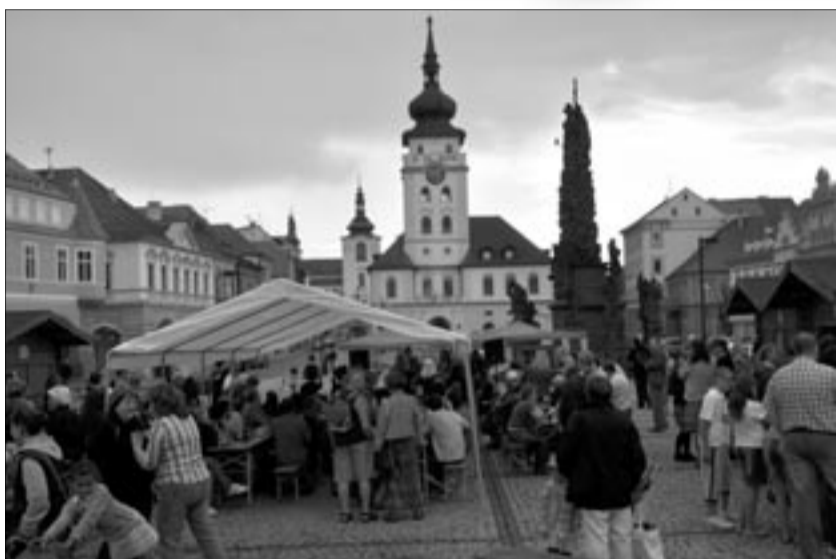
Žatečáci i návštěvníci města se baví při živé hudbě na náměstí Svobody

Žatec – Šedesát tisíc korun obdrželo město Žatec za jediný natáčecí den od společnosti U.F.O. Pictures, s.r.o.. Ta pořizovala záběry v centru města v pondělí, například v prostoru Libočanské branky. Jednalo se o natáčení reklamního spotu na pivo s názvem Žatecká husa. (st)