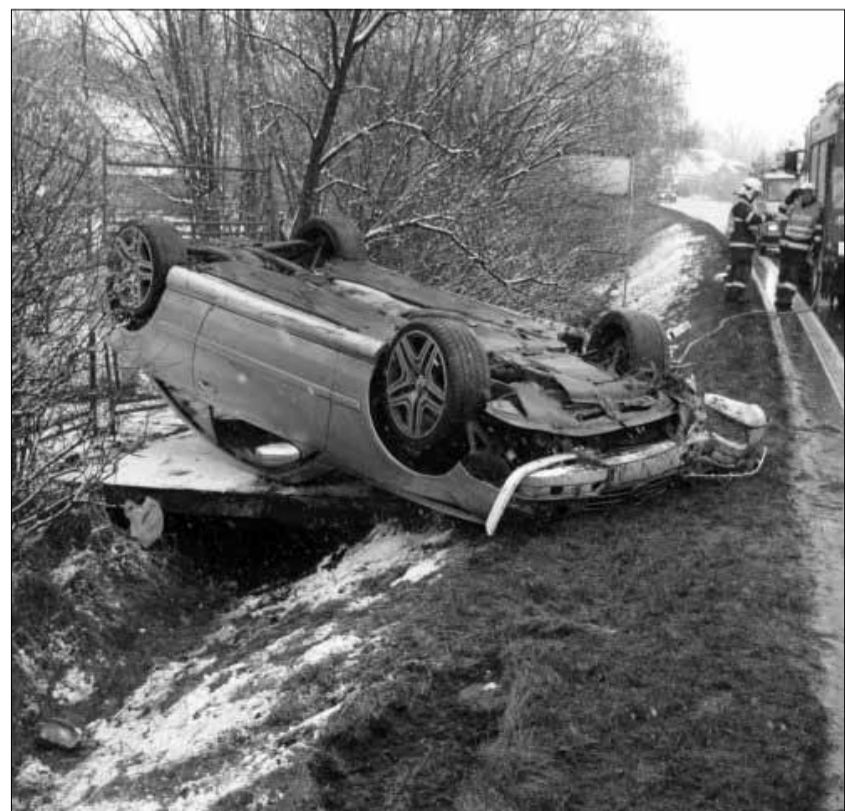
Jakou asi rychlostí musel jet 13. ledna řidič, který na Plzeňské ulici v Žatci v úseku mezi ulicemi Ceradická a Kadaňská, kde je povolena maximální rychlost 60 km(!), obrátil na střežku mercedes? Sám sice vyšel bez zranění, ale na voze je škoda odhadnuta na 2 miliony korun.