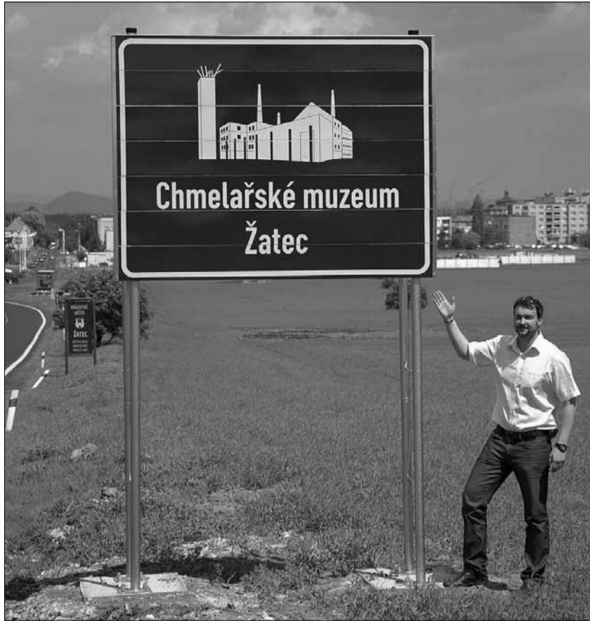
Pět nových turistických dopravních značek láká nyní návštěvníky do Žatce. Jde o dopravní značky, na kterých jsou cíle památková rezervace a chmelařské muzeum. Dopravní značky doplňují dvě stávající cedule a jsou umístěny ve směru příjezdu do Žatce od Písně, Mostu a Chomutova.