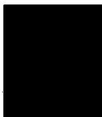
Věra Vobrová/ vedoucí stavebního úřadu

Lhůta pro podání odvolání se počítá ode dne následujícího po doručení písemného vyhotovení rozhodnutí, nejpozději však po uplynutí desátého dne ode dne, kdy bylo nedoručené a uložené rozhodnutí připraveno k vyzvednutí.