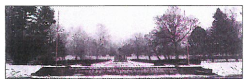
PAMÁTNÍK OBĚTEM 2. SVĚTOVÉ VÁLKY Z ČESKÉHO MALINA V ŽATCI