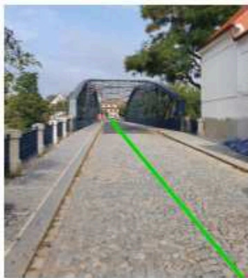
pohled z Husitského náměstí na Železný most (2021)