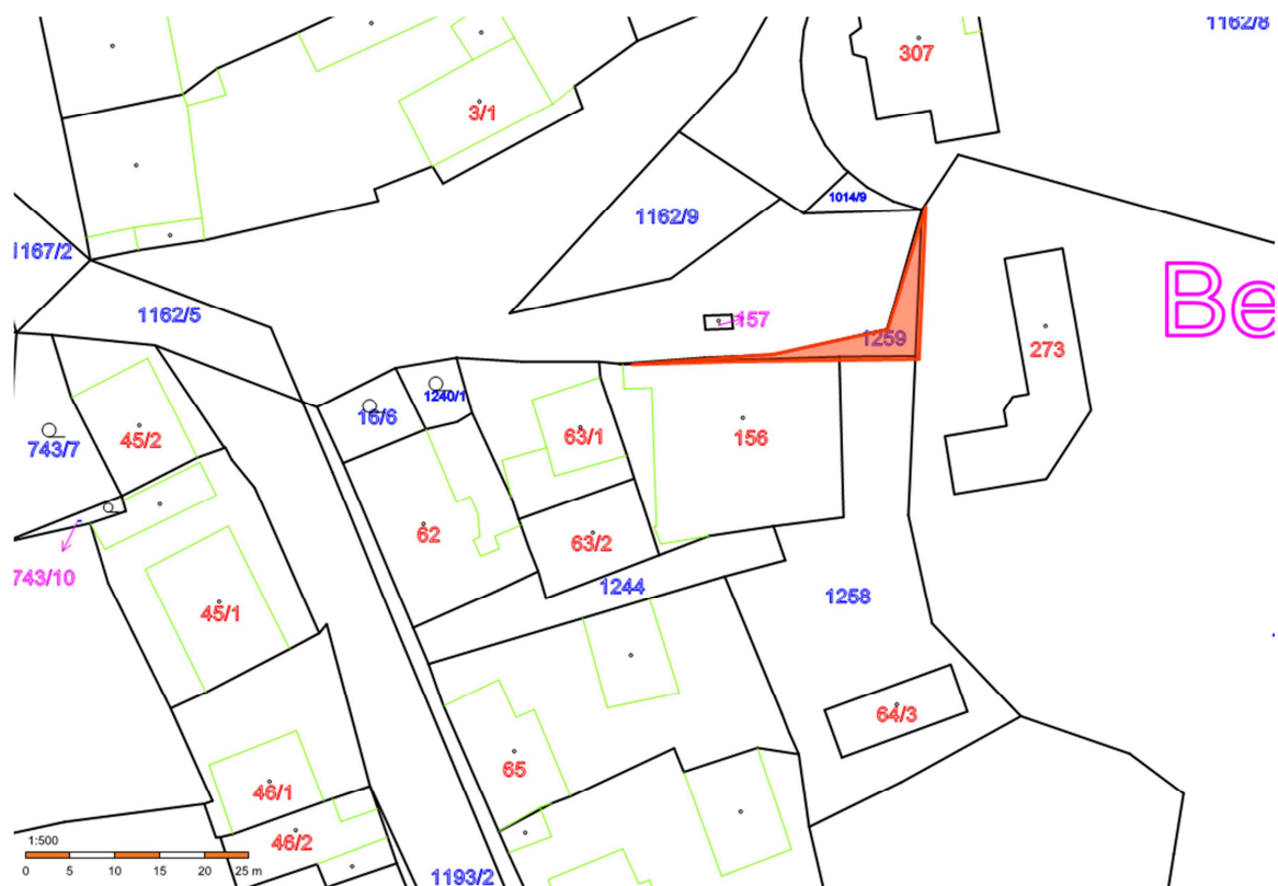
výřez z katastrální mapy – orientační zákres

Na pořízení územního plánu nebo jeho změny není právní nárok, i když navrhovatel splní všechny předepsané náležitosti. Pokud je pořízení územního plánu vyvoláno výhradní potřebou navrhovatele, může město požadovat úplnou nebo částečnou úhradu nákladů na zpracování změny projektantem a na mapové podklady, přitom město nemůže garantovat vydání změny v souladu s požadavky navrhovatele, protože vydání změny je výsledkem jejího projednání, které může město ovlivnit jen částečně.