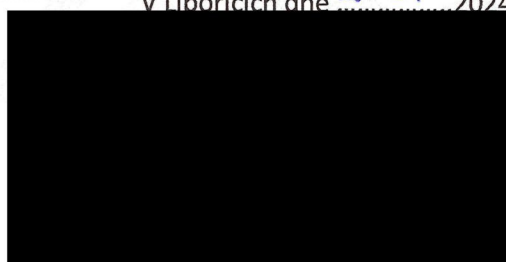
Obec Libořice Antonín Kvapil