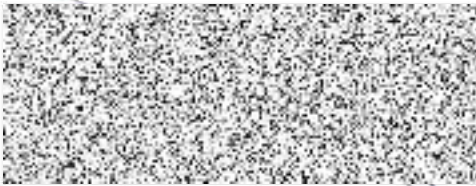
Ing. Radim Laibl starosta města Žatce

Výroční zpráva bude zveřejněna v souladu s ustanovením § 18a InfZ v centrálním registru Ministerstva vnitra.