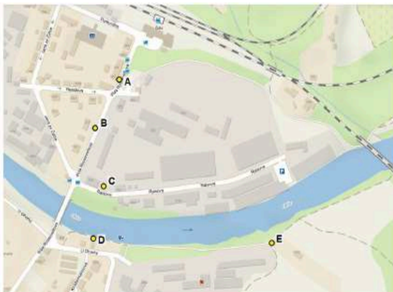
Obrázek 2 Místa měření hluku

dokumentace ke zjišťovacímu řízení podle zákona č.100/2001 Sb. , kterou si nechala zpracovat f. HP-Pelzer. Přikládám tabulku měření hluku v noční době, pro kterou platí hygienický limit ve výši 40 dB . Ani jedno měření nevyhovělo hygienickým limitům! Většina naměřených hodnot se pohybuje okolo 50 dB !!!